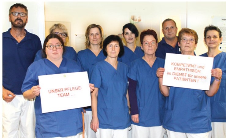
Das Pflegeteam der Ostseeklinik leistet großartige Arbeit und ist permanent im Einsatz.

Unermüdlich sind sie im Einsatz – die Mitarbeiterinnen des Pflegeteams der Ostseeklinik Prerow. Hand in Hand sorgen sie Tag für Tag für das Wohl der Patientinnen. An dieser Stelle gilt es, ihre außerordentliche Leistung zu würdigen und ein Dankeschön auszusprechen.