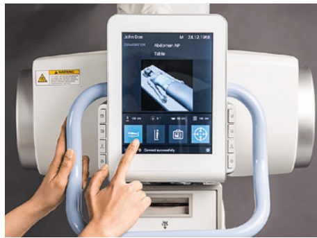
Die neue hochmoderne digitale Röntgenanlage ist seit 15. März 2022 im Einsatz.

Präziser diagnostizieren: Mit der neuen digitalen Röntgenanlage lassen sich die durchzuführenden Aufnahmen weitaus leichter einstellen. Noch ein wichtiger Aspekt: Bei der konventionellen Röntgenmethode wird Filmmaterial belichtet und entwickelt. Die Aufnahmen werden manuell abgelegt und mit relativ hohem Aufwand archiviert.